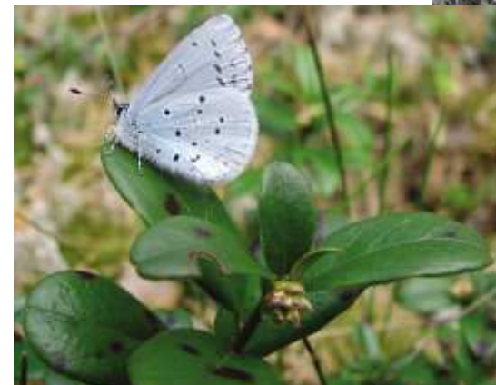
Store Mosse, en tillbakablick.