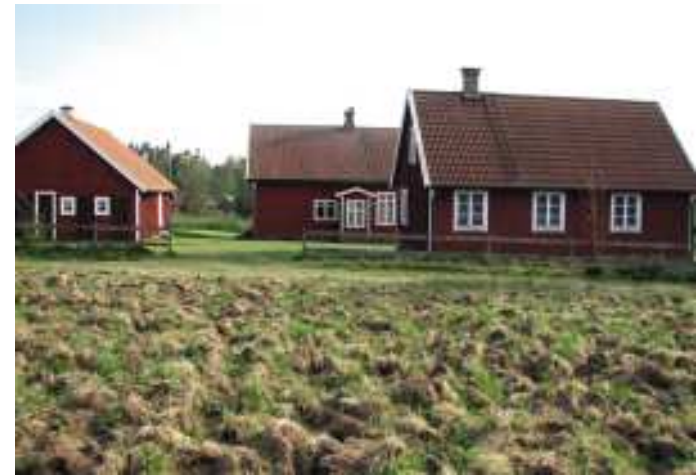
Bygdegården i Sönder Össjö

Därefter konstaterar dock länsstyrelsen "att den berörda jordbruksmarken kan tas ur produktion utan att skada naturvårdsintressen. Åtgärden kommer att medföra viss negativ inverkan på värdena för kulturmiljön men inte till den grad att ett avslag kan motiveras."