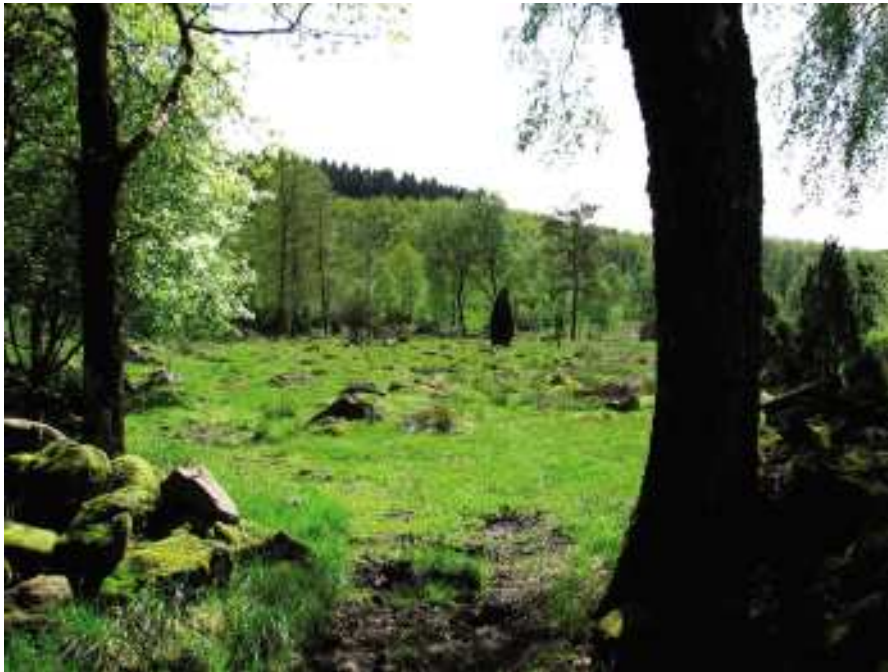
Krökatorpets fägata leder ut till byns fäladsmark.

Två tydliga fägator, stråden finns markerade på kartan. Bägge kan utan svårighet återfinnas i nutid. Vi har den korta, breda fägatan från Ingeborrharpsgården och den ganska smala, långsträckt gatan från Krökatorpet. Någon motsvarande bevarad fägata från Sigfrids gård är inte känd, men en sådan kan ju även ha varit helt i trä. Under byns äldre tid har alltså djuren släppts ut på fäladen i söder för att finna bete. Denna fälad avgränsades i norr av det stengärde som ligger i höjd med den återupbyggda backstugan. I väster avgränsades denna utmark från inägornas ängs- och åkermark av det