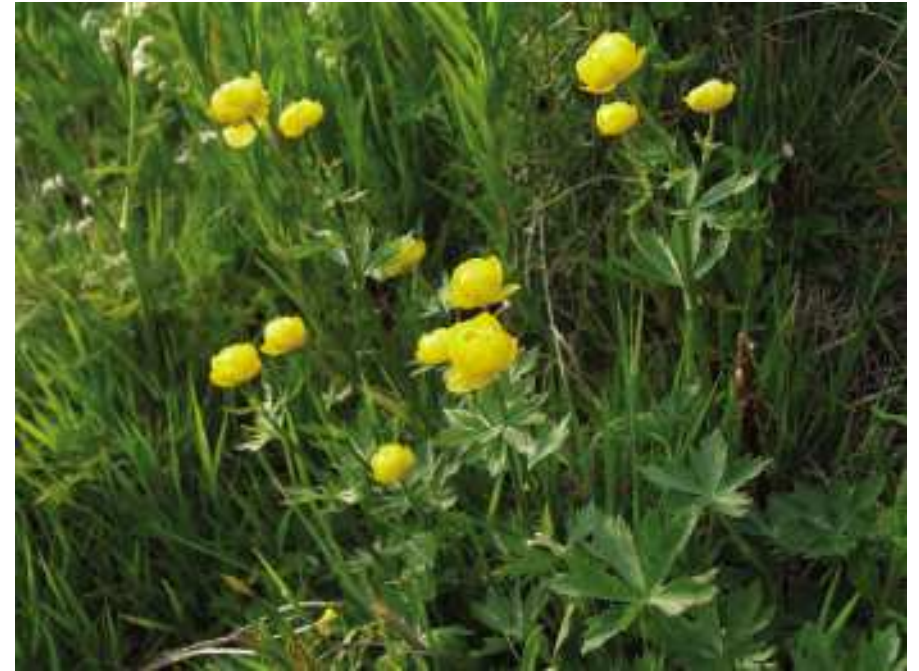
Smörbollen är en i sydsverige slättergynnad art.

kerna, att han fått plöja upp och så in en del av de gamla, sen länge oplöjda åkrarna. Han skulle dessutom gärna velat uppleva att själva Ingeborrarsgården fått mer liv, att man åter skulle kunna få husa ett par hästar, ett par kor, en sugga, en galt och kanske någon get. ”Men man hade förstås fått söka dispens från vissa av djurskyddsbestämmelserna för att få hålla djur i de gamla byggnaderna”, säger han lite eftertänksamt.