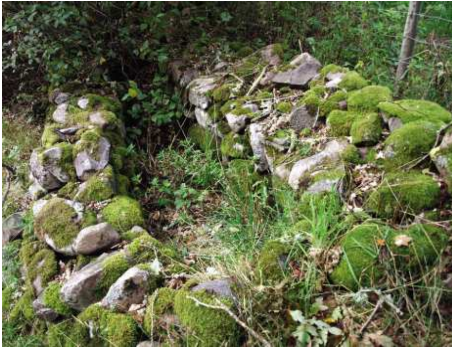
Brydehålan bakom restaurangen.

Allmänt bör växter som smörbollar, slättergubbe, ängsruta, jordtistel, jungfrulin och gökblomster påkalla extra omtanke i samband med skötseln av betesmarkerna. Även