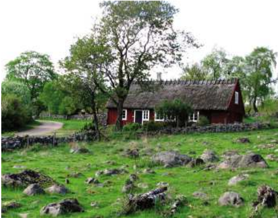
Backstugan och den steniga fäladsmarken.

Ett otal böcker har framsprungit från denna hembygdsförening, ofta ”signerade”, författade av Nils Arvid Bringéus och nästan lika ofta illustrerade med fotograf Sven Hjalmarssons benägna bistånd. När vi i dessa artiklar om Ingeborrarsområdet även