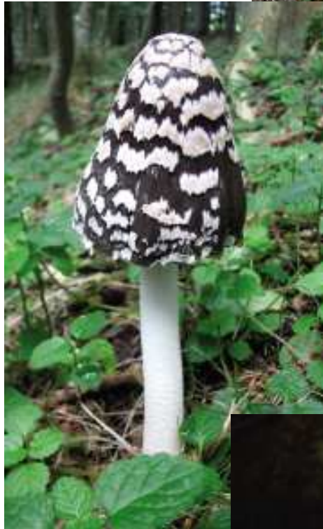
Fjällig tofsskivling, rutbläcksvamp och porslinsnagelskivling, några udda inslag i svampskogen.