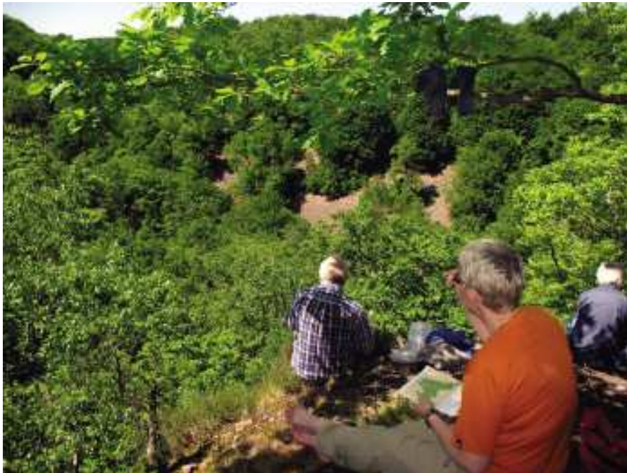
En magnifik utsikt högt över Korsskär.

Efter en del dividerande bestämde vi oss för att gå en 7 km lång runda, som skulle ta oss runt i parken på ett trivsamt sätt. Jan som agerade exkursionsledare, berättade helt kort om parken, exempelvis att det pågår ett projekt, "Life"-projektet som går ut på att återskapa lövskogen i parken. Det har som på många ställen planterats mycket gran och en del lärk, detta tas ned och ersätts med bland annat bok. Söderåsens nationalpark är 1625 ha stor, varav 1520 ha består av skogsmark. Resten av parken är en