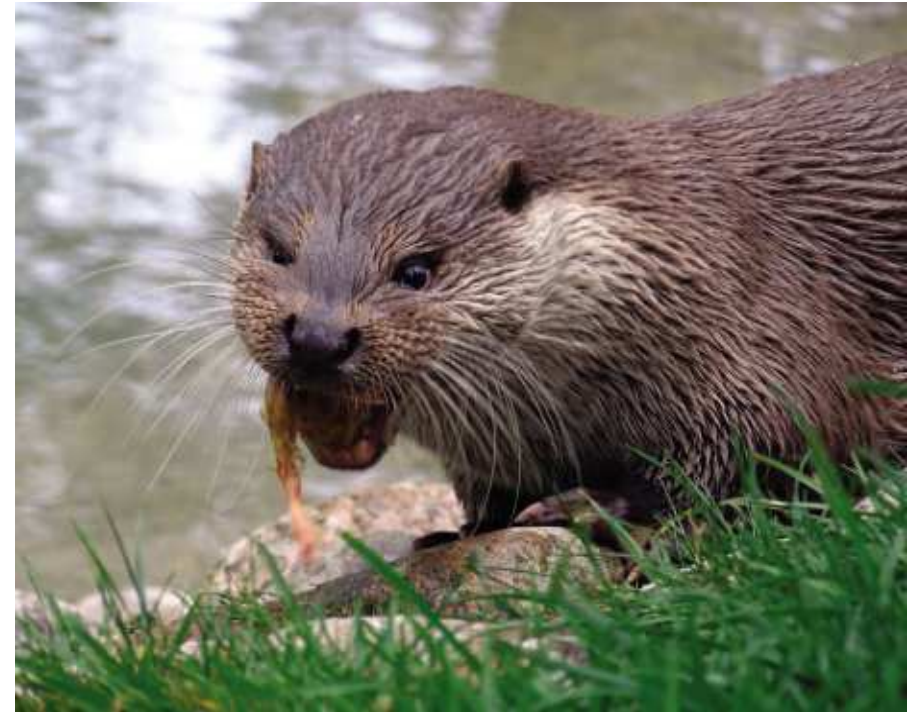
Utter, Lutra lutra