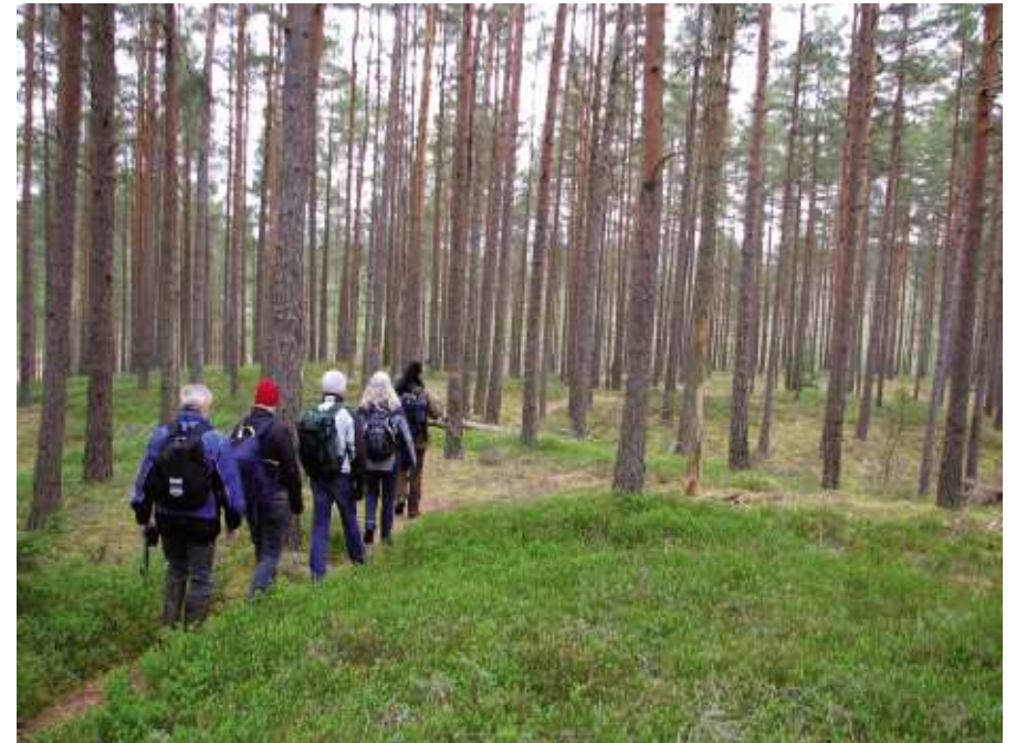
Gåsmarch över rocknarna.

Roslingen har precis börjat blomma så här i början av maj. Silesår syns här och där med sina glupska tentakler som är på väg att utvecklas. Tuvull, tranbär... det märks