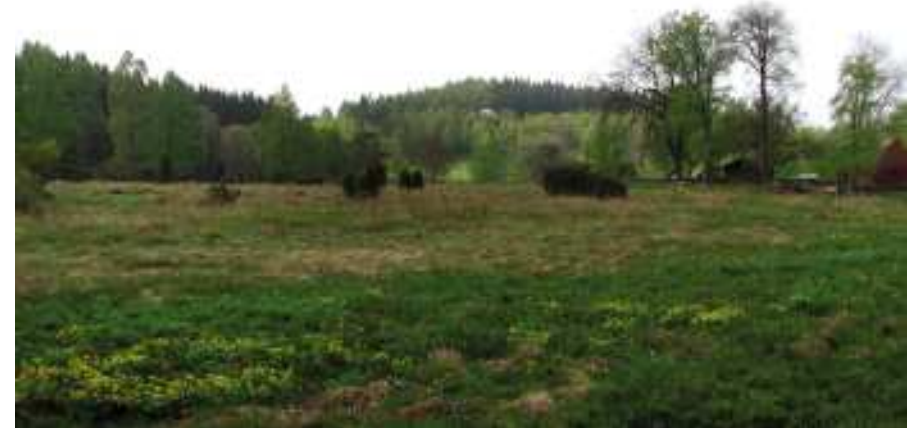
Betesmarken mellan Krökatorpet och Ingeborrarpsgården, en före detta ängsmark.

Men visst hade man under 1800-talets andra hälft utvidgat den förut säkert sparsamt tilltagna åkermarken. På kartan är åker markerad med svagt gul färg . Generellt sett