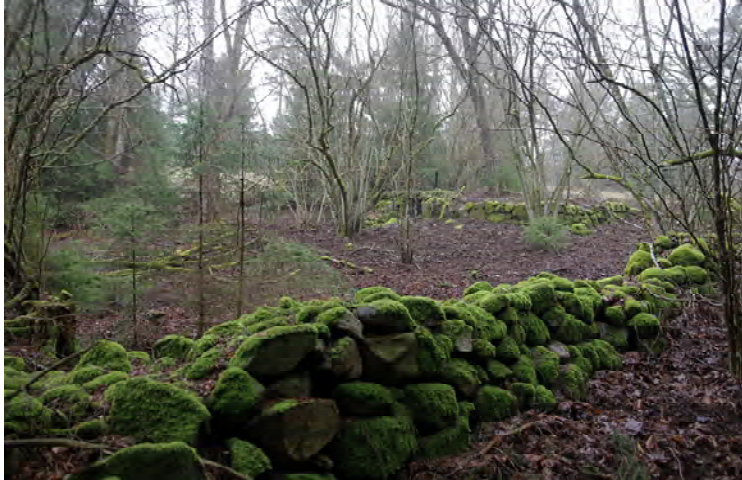
Här bodde en tid den ökände dynamitarden "Bildsköne Bengtsson"

Grusvägarna gav oss bekväm vandring, men vi var förstås också tvungna att ge oss ut i den blöta myrskogen en stund. Man fick se efter var stövlarna placerades och akta sig för halvöppna dikesstråk. Ett av målen var att komma till kanten av ett mer utdraget, draglikt område. Detta låg i förbindelse med den centrala del av myren där flera byars myrmark sammanstrålar, det gäller faktiskt för både Mörkhult, Killhult, Sandhult, Yxen-