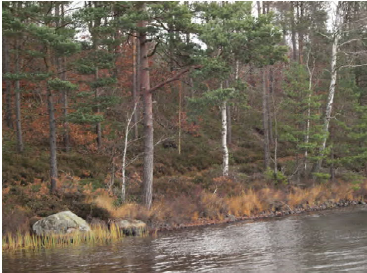
Tallblandskog på sjöns nordsida.

Efter en regnig och stormig natt blev det en fin och solig förmiddag. Vi blev fem personer som från badplatsen gav oss iväg medurs runt sjön. Vi drog oss nära strandlinjen längs sjöns norra sida genom den tall- och delvis bokdominerade skogen. För att undvika återvändsgränder vid de strandnära stugorna vandrade vi sen uppför slänten till Åsljungapallens område för att därefter följa asfältvägen mot Sonnarp.