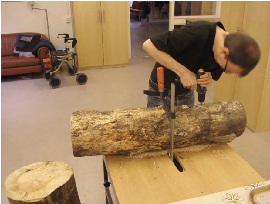
Tillverkning av bihotell

Efter Sörenssons inspirerande exkursion började funderingar växa fram kring att göra insatser i detta område för att gynna vildbin och att sprida information om detta. Kommunens Dagliga verksamhet LSS (Lag om stöd och service till vissa funktionshindrade) tog tag i idén och började arbeta utifrån ett samverkansperspektiv där kopplingen till Örkebygdens Natur var betydelsefull. Frågan var uppe på ett av föreningens ÖN:s styrelsemöten som där uttryckte sitt stöd för projektet. Även kommunens Naturvårdsgrupp såg idén som intressant och av värde att arbeta vidare med. Det primära målet blev att grustäkten på lämpligt sätt åtgärdas och fortsättningsvis sköts på ett sådant sätt att vildbin både gynnas och uppmärksammas. Men även andra naturvårdsfrågor kom upp. Exempelvis planerar kretsen att göra grävningar för att återställa boplatser åt baksvalor.