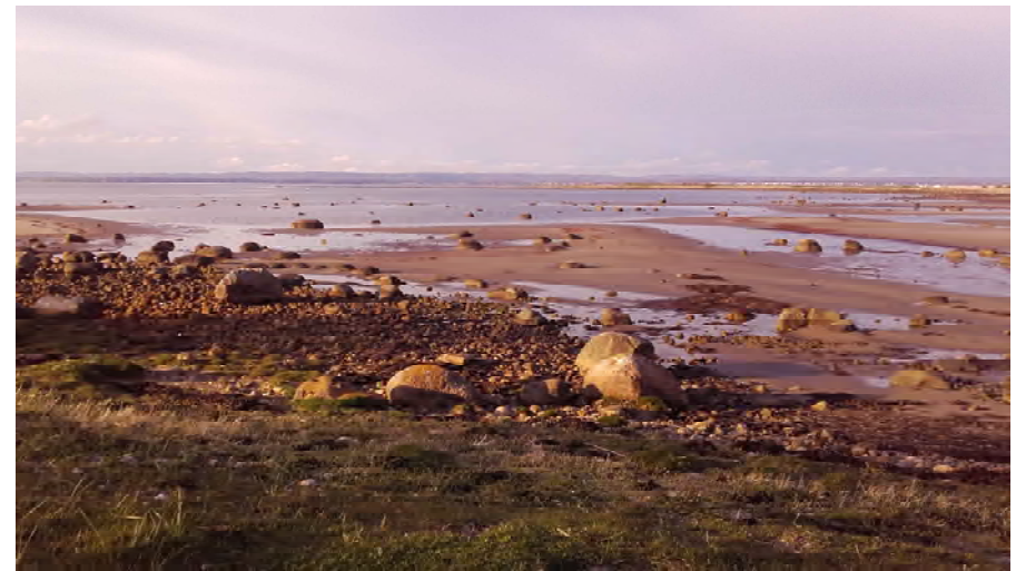
Sandbankarna vid Rönnen lockar många vadare

Vi vandrade, med både tubkikare och fikakorgar, den lilla biten längs kusten tills det öppnar upp sig och vi har full syn ut över Skäldervikens fågelliv. Där ställdes det upp som om vi vore ett paparazzi-gäng på jakt efter celebriteter! Snabbt scannade vi av vad som fanns födosökande i strandkanten. Vad är det för långnäbbad? Ah, en storspov minsann! Skärfläckorna visade vackert upp sig där de gick i sin svartvitbrokiga dräkt med tydligt uppåtböjd näbb. Någon såg en gulärta, då ville vi ju alla hitta den skönheten. Inte så lätt att beskriva vid vilken sten den rör sig då de ligger utslängda som spelkulor lite varstans. Rackarns vad den lös gult i kvällssolen!