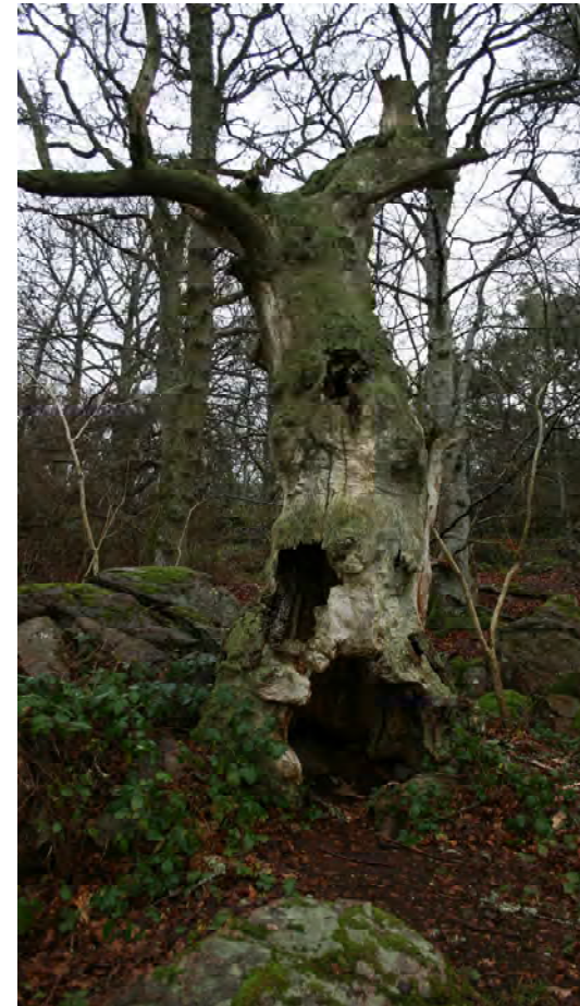
En av öns stora döda ekar