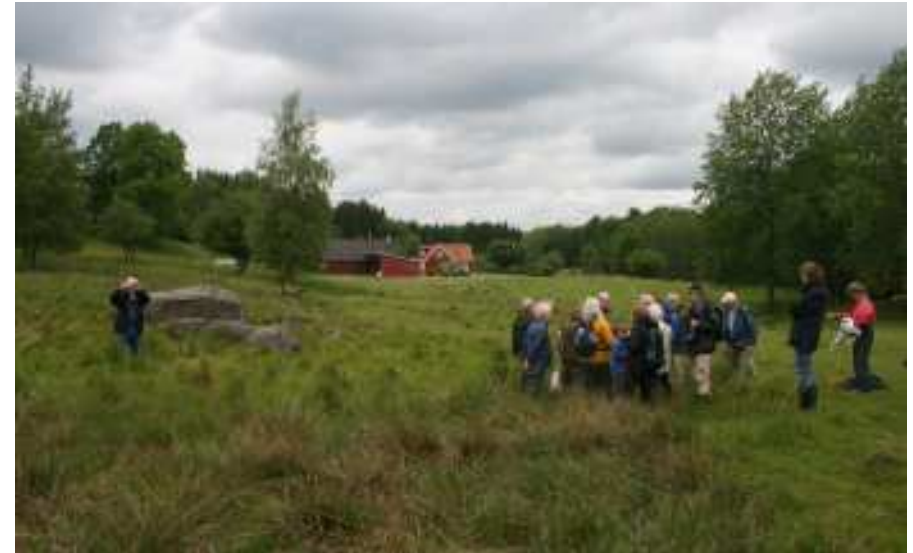
Här växer både Jungfru Marie nycklar, stagg och revfibbla

inhägnad mark intill det s.k. Gatehuset. Är det granskogsmark som vräkts ner av "Gudrunstormen" som sen planterats med löv? Vi misstänker att skogsförvaltaren försöker dra upp snabbväxande hybridasp. Vi vet inte säkert. Längs vägen mot