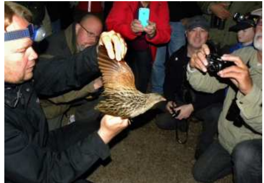
Det är inte ofta man får se en kornknarr på nära håll

I samband med skiftesrörelsen under 1800- och början av 1900-talet gjordes stora delar av landskapet om till åker och foderodlingsarealer, till exempel klövervall. Detta kunde arten anpassa sig till. Det är till och med möjligt att den gynnades av den nya situationen, eftersom omfattningen av öppen mark ökade genom skogsröjningar och sjösänkningar. ... Värre var det att slåttern började skötas med maskin och att den tidigarelades. Ett exempel på vad detta innebar för kornknarrrens fortplantningsmöjligheter lämnades 1933 från en gård i Uppland. Under höskörden detta år hade 18 ungar och två honor av arten blivit dödade (Brehm-Ekman)!