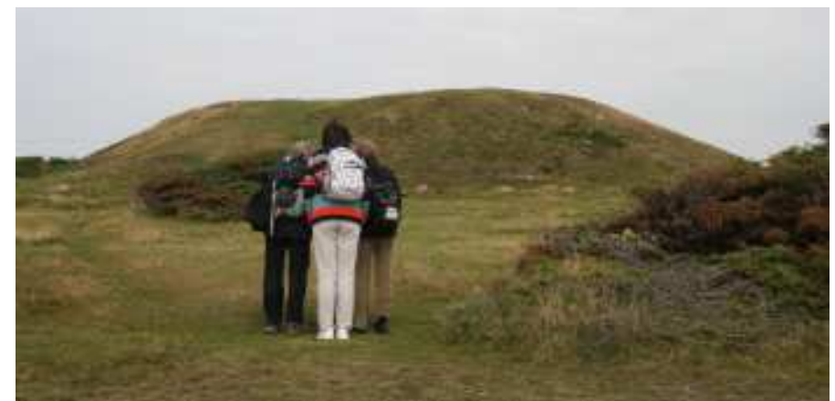
I vördnad inför bronsåldersgraven Dagshög