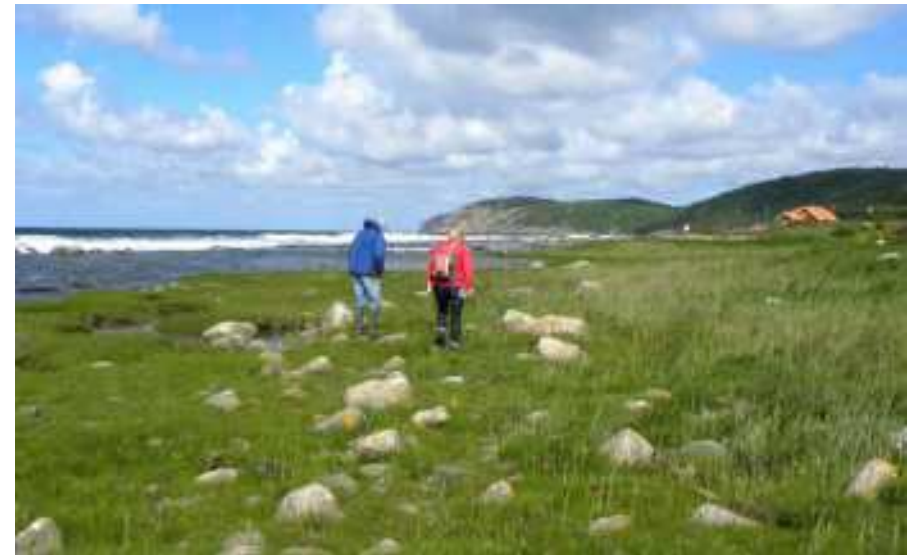
Strandäng söder om Mölle med Kullaberg i bakgrunden

Vi var åtta medlemmar som drog i väg mot Kullaberg. I Mölle tillstötte Molly med familj så vi blev en lagom expedition på detta botaniska El Dorado. Första lokalen var en lite blåsig strandäng i södra utkanten av samhället. En försiktig början med en stor del av de vanligaste arterna på salta ängar. Strandkrypa, salttåg, havssälting, saltarv, havs-