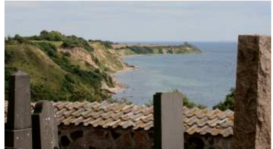
Utsikt över backafallen från S:t Ibb

Som vanligt guidade Zigge oss villigt i Floras rike och på denna exkursion var det ofta behov av en botanist. På kvällen summerades dagens artlista och man fick ihop hela 228 växtarter! Här kommer bara ett urplock att göras. Utmed stranden fanns på en